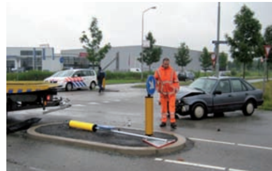
Aanrijding op 12 juni j.l.

Het idee bestaat dat er met enige regelmaat een wedstrijd aan de gang is. Met name op de Aquamarijweg nabij de kruising met de Toermalijnring (ANVD) zijn de snelheden gevaarlijk hoog. De situatie nodigt u misschien hiertoe uit als u vanaf de N3 de hoogte af komt rijden. Uiteraard is dit niet de bedoeling, 50 kilometer per uur is echt voldoende. Natuurlijk wil iedereen graag op Kil III werken, maar het is ook prettig als u dit zonder kleerscheuren en materiele schade ook kunt gaan doen.