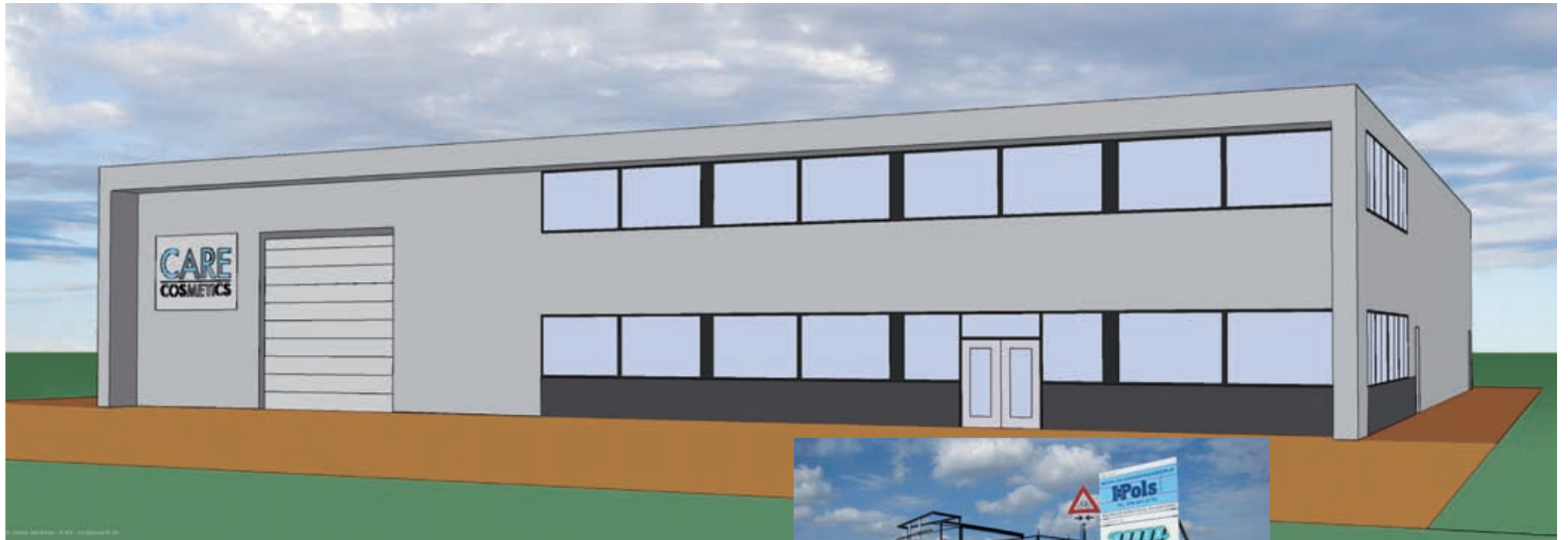
Het nieuwe pand van Care Cosmetics.

De ontwikkelingen op ons bedrijventerrein gaan hard. Diverse bedrijven zijn in aantocht of hebben hun deuren inmiddels geopend. De meeste ondernemingen haken aan bij de al regelende collectieve voorzieningen en profiteren dus direct mee van het aanwezige parkmanagement.