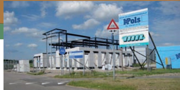
De bouw van het nieuwe Vorex pand.

Zoetwaren hebben de nog beschikbare grond naast hun al bestaande panden aangekocht. Dit met oog op mogelijke uitbreiding in de toekomst.